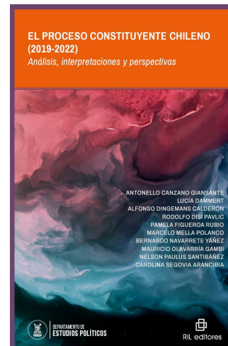
EL PROCESO CONSTITUYENTE CHILENO (2019-2022)