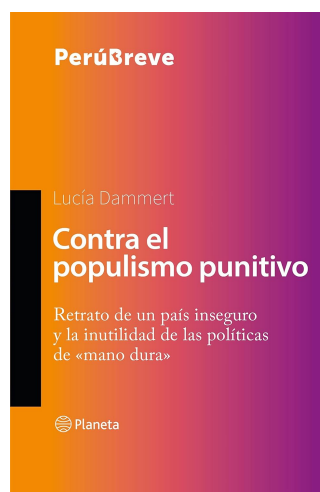
CONTRA EL POPULISMO PUNITIVO