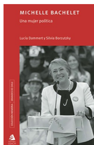
UNA MUJER POLITICA