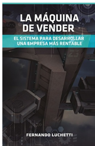
LA MÁQUINA DE VENDER