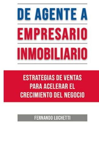
DE AGENTE A EMPRESARIO INMOBILIARIO