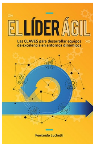
EL LÍDER ÁGIL