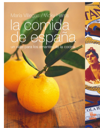
LA COMIDA DE ESPAÑA