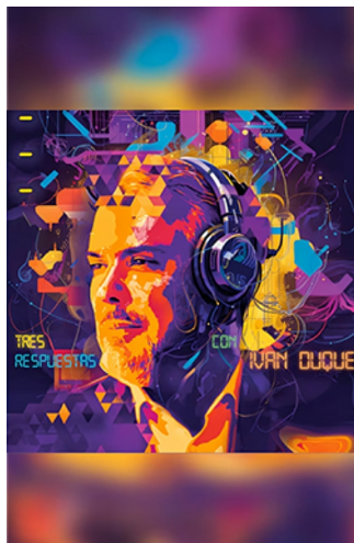
PODCAST: TRES RESPUESTAS CON IVÁN DUQUE