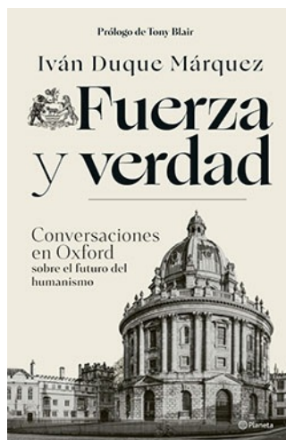
FUERZA Y VERDAD