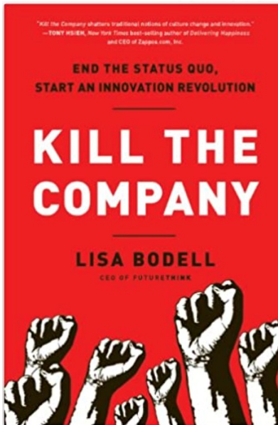
KILL THE COMPANY