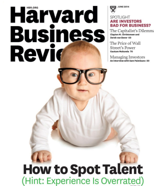
HARVARD BUSINESS REVIEW - HOW TO STOP TALENT?