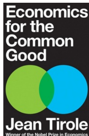
ECONOMICS FOR THE COMMON GOOD