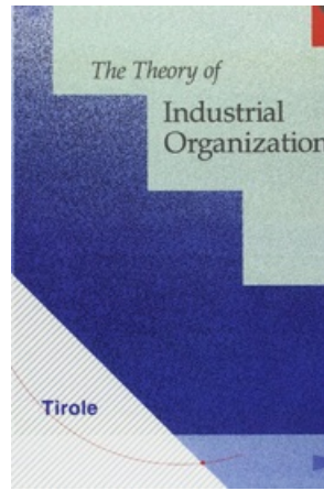
THE THEORY OF INDUSTRIAL ORGANIZATION