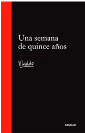
UNA SEMANA DE QUINCE AÑOS