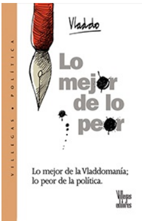
LO MEJOR DE LO PEOR