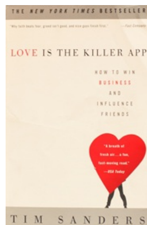
LOVE IS THE KILLER APP