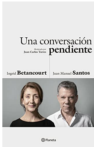
UNA CONVERSACIÓN PENDIENTE