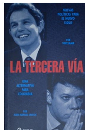
LA TERCERA VÍA