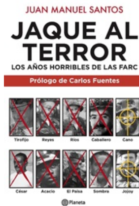
JAQUE AL TERROR