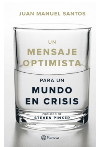
UN MENSAJE OPTIMISTA PARA UN MUNDO EN CRISIS