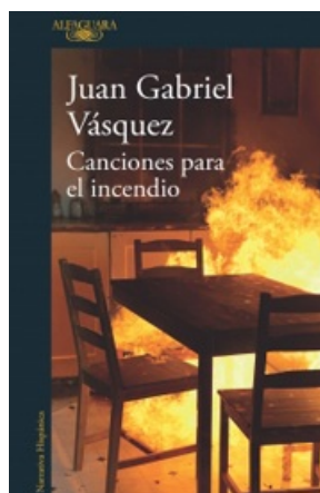
CANCIONES PARA EL INCENDIO