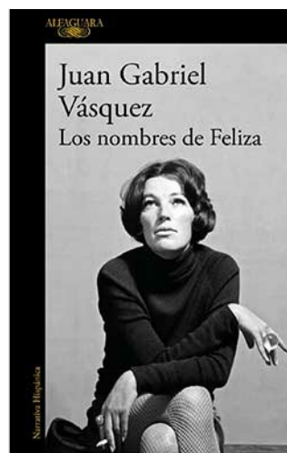
LOS NOMBRES DE FELIZA