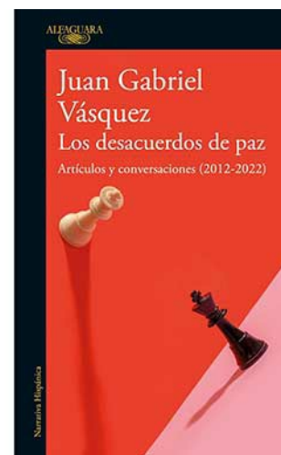
LOS DESACUERDOS DE PAZ