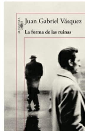
LA FORMA DE LAS RUINAS