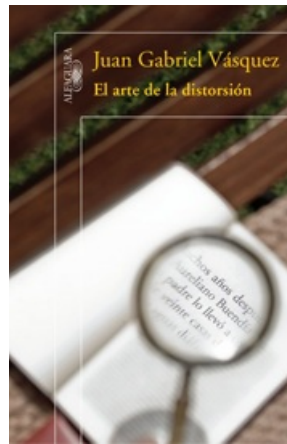
EL ARTE DE LA DISTORSIÓN