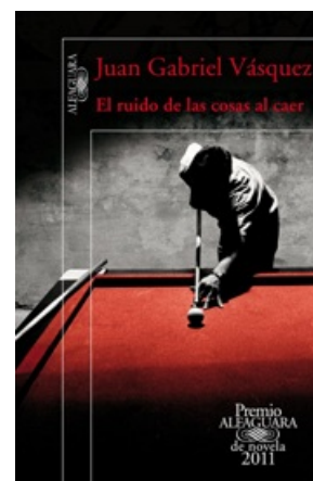
EL RUIDO DE LAS COSAS AL CAER