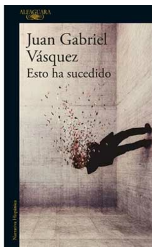
ESTO HA SUCEDIDO