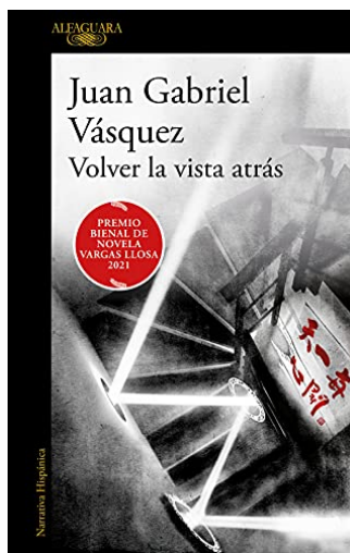
VOLVER LA VISTA ATRÁS