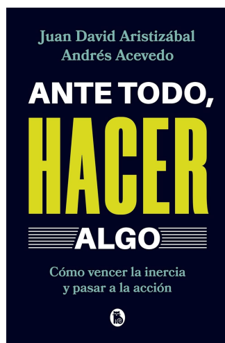
ANTE TODO, HACER ALGO