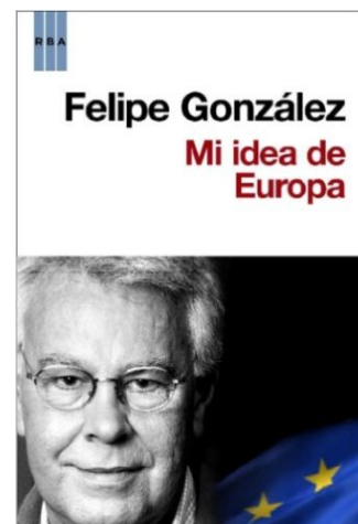
MI IDEA DE EUROPA