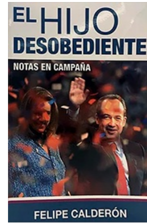
EL HIJO DESOBEDIENTE