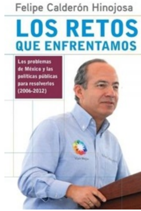
LOS RESTOS QUE ENFRETANTAMOS