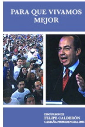
PARA QUE VIVAMOS MEJOR