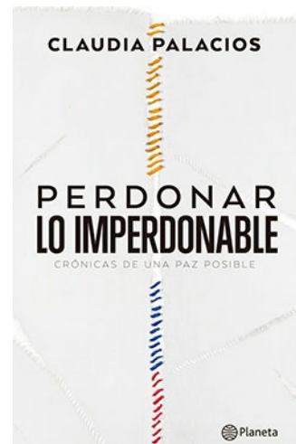
PERDONAR LO IMPERDONABLE