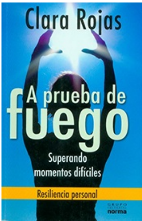
A PRUEBA DE FUEGO