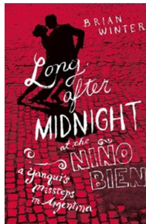
LONG AFTER MIDNIGHT AT THE NINO BIEN