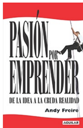
PASIÓN POR EMPRENDER