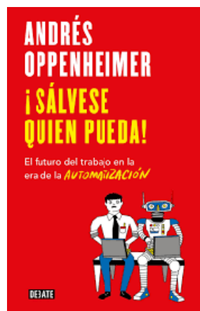
SÁLVESE QUIEN PUEDA