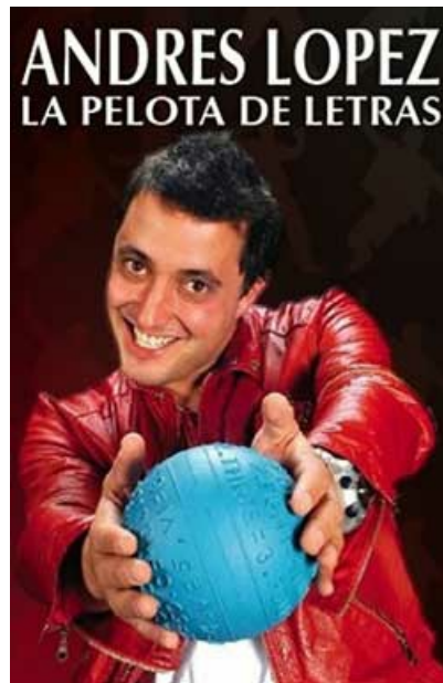
LA PELOTA DE LETRAS