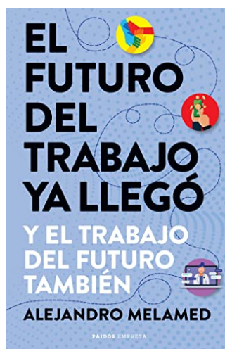
EL FUTURO DEL TRABAJO YA LLEGÓ