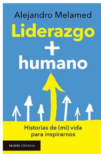
LIDERAZGO + HUMANO