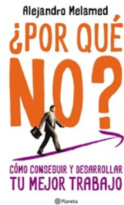
POR QUÉ NO?