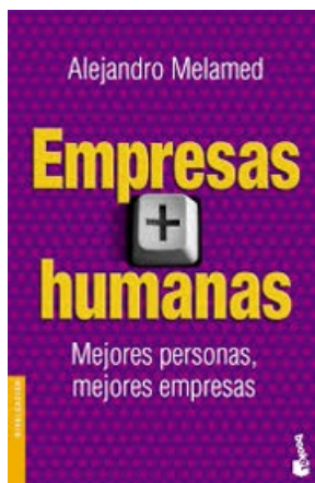
EMPRESAS + HUMANAS