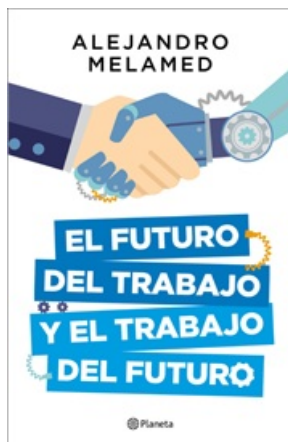
EL FUTURO DEL TRABAJO Y EL TRABAJO DEL FUTURO