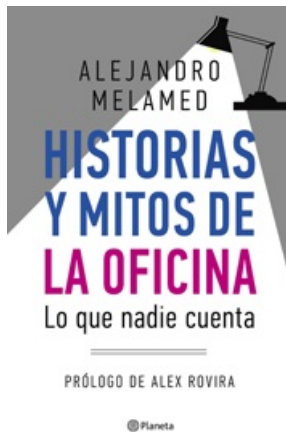
HISTORIAS Y MITOS DE LA OFICINA