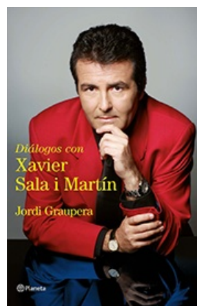
DIÁLOGOS CON XAVIER SALA I MARTÍN