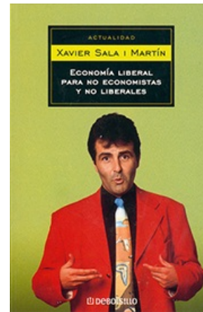
ECONOMÍA LIBERAL PARA NO ECONOMISTAS