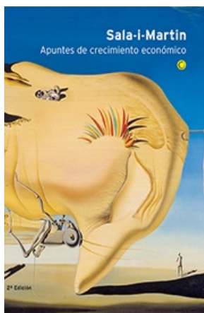
APUNTES DE CRECIMIENTO ECONÓMICO