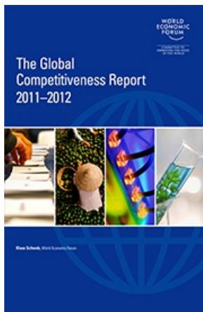
THE GLOBAL COMPETITIVENESS REPORT