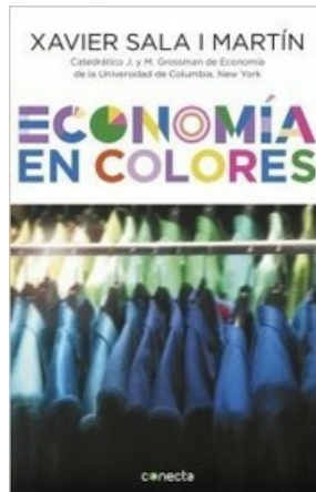
ECONOMÍA EN COLORES