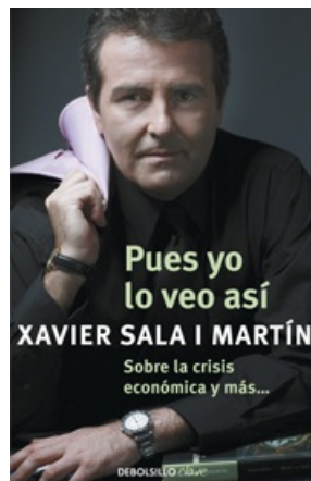
PUES YO LO VEO ASÍ