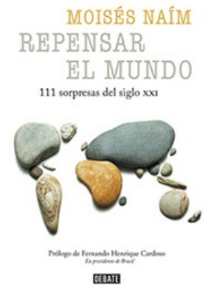
REPENSAR EL MUNDO