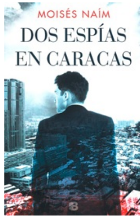
DOS ESPÍAS EN CARACAS