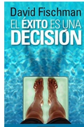
EL ÉXITO ES UNA DECISIÓN