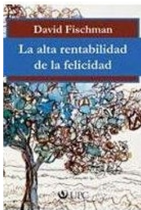
LA ALTA RENTABILIDAD DE LA FELICIDAD