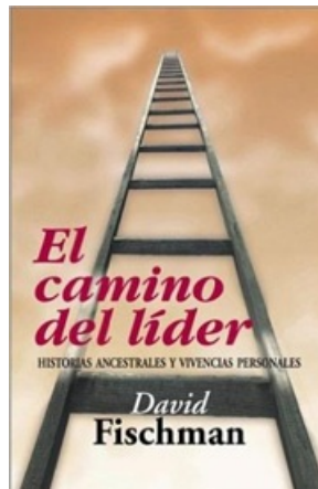
EL CAMINO DEL LÍDER