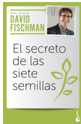
EL SECRETO DE LAS SIETE SEMILLAS